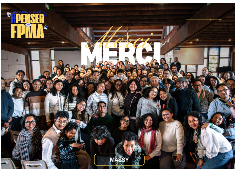
Photo Evènement Repenser la FPMA 28/02/2026 à Massy

Rehefa tapitra ny ain'i Jesosy ry Havana teo amin'ny hazo fijaliana dia nitriatra ny lamba manasaraka ny efitra masina sy ny efitra masina indrindra tao amin'ny Tempoly (Mt.27.51). Izany dia midika fa ny famonjena vitany teo amin'ny hazo fijaliana dia nampihavana antsika mivantana amin'Andriamanitra Ray. Ny apostôly Paoly koa dia